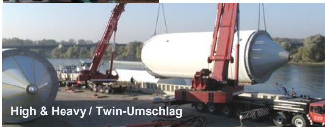
High & Heavy / Twin-Umschlag